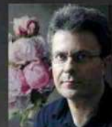
GIANLUCA CORONA Nasce a Milano, dove vive e lavora, nel 1969. Diplomato all'Accademia di Brera, si distingue già a metà degli anni Novanta tra gli esponenti della Giovane figurazione italiana per la sua sensuale rilettura della forma della natura morta e del ritratto e per una attenti- sima ricerca delle tecniche tradizionali. Espone le sue opere presso la galleria Salomon Fine Art di Milano.