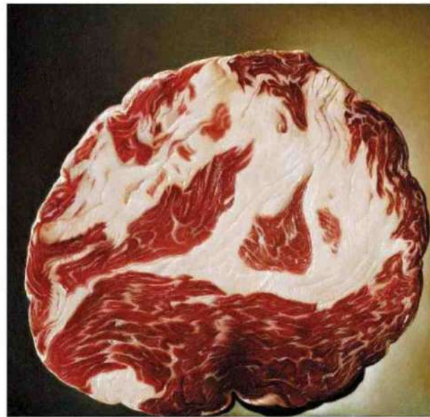
← TROPEA, 2013 olio su tela, cm 55x30

D alle nostre ricerche a livello nazionale e internazionale emerge che il ruolo dell'enogastronomia nel turismo è profondamente cambiato, è divenuto un driver di viaggio fondamentale in tutto il mondo. Ritengo che, attraverso questo progetto, potremo valorizzare tale sinergia per farne un motore di ripartenza in un momento così complesso come quello attuale. E lo faremo partendo dai nostri prodotti, dalle nostre ricette, così come dalle storie dei produttori, dalle tradizioni locali e dai paesaggi che diventano enogastronomici in un'ottica di integrazione tra innovazione, sostenibilità e rispetto delle tradizioni».