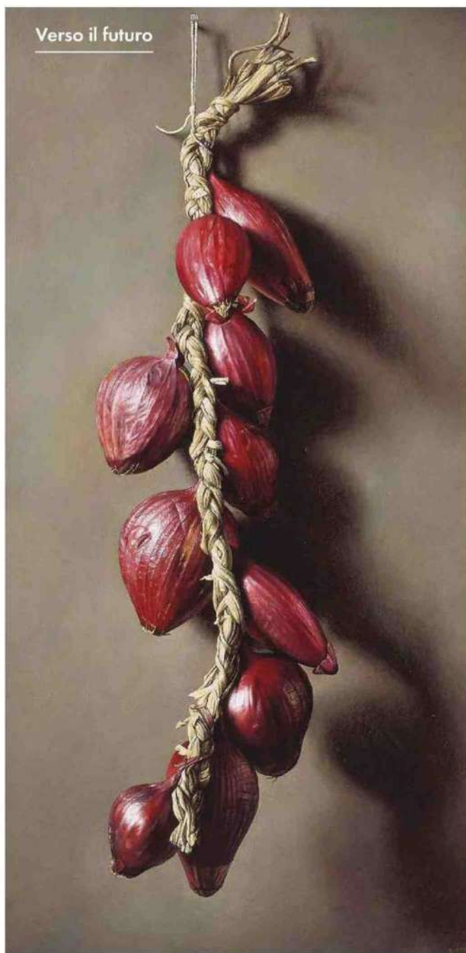
18 - LA CUCINA ITALIANA