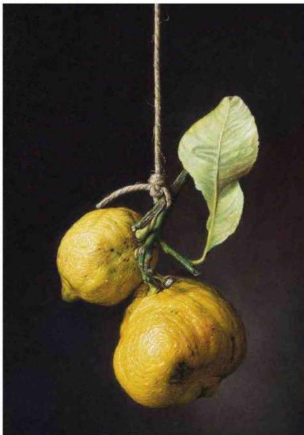
← PANE E FORMAGGIO, 2018 olio su tavola, cm 35x45

D a studioso dell'alimentazione nella sua prospettiva storico-antropologica e letteraria, ritengo che la cucina italiana vada ulteriormente promossa nelle sue valenze culturali, rituali e simboliche. Sia a livello nazionale sia mondiale. La cucina è una costruzione tanto materiale quanto immateriale nel gesto del riunirsi intorno a una tavola per condividere il pasto. Una consuetudine che è anche uno dei tratti che ci caratterizza