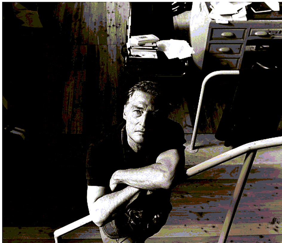
Emilio Tadini ritratto nel suo studio, oggi Casa Museo

La collaborazione al «Corriere d'informazione» testimonia il momento di riflessione sul romanzo e di elaborazione narrativa in vista della svolta verso la pittura, che diventerà pubblica con le mostre del 1966. Se la lettura di questi interventi corriereschi offre spunti notevoli sul suo percorso poetico e teorico, grazie alla sensibilità culturale e sociale di Tadini la meraviglia del lettore si estende alla temperie generale su cui si sofferma l'acutissimo sguardo dell'osservatore-lettore-commentatore. Tadini è infatti un lettore che nel leggere, analizzare, giudicare un libro non cessa mai di guardarsi intorno: si tratti di poesia, di narrativa, di società o di costume, il suo è sempre un occhio (e un orecchio) curioso e inquieto. Tre filoni di interesse emergono su tutti: le riflessioni metanarrative, l'attenzione ai classici moderni, le ascoltazioni delle tendenze editoriali del mo-