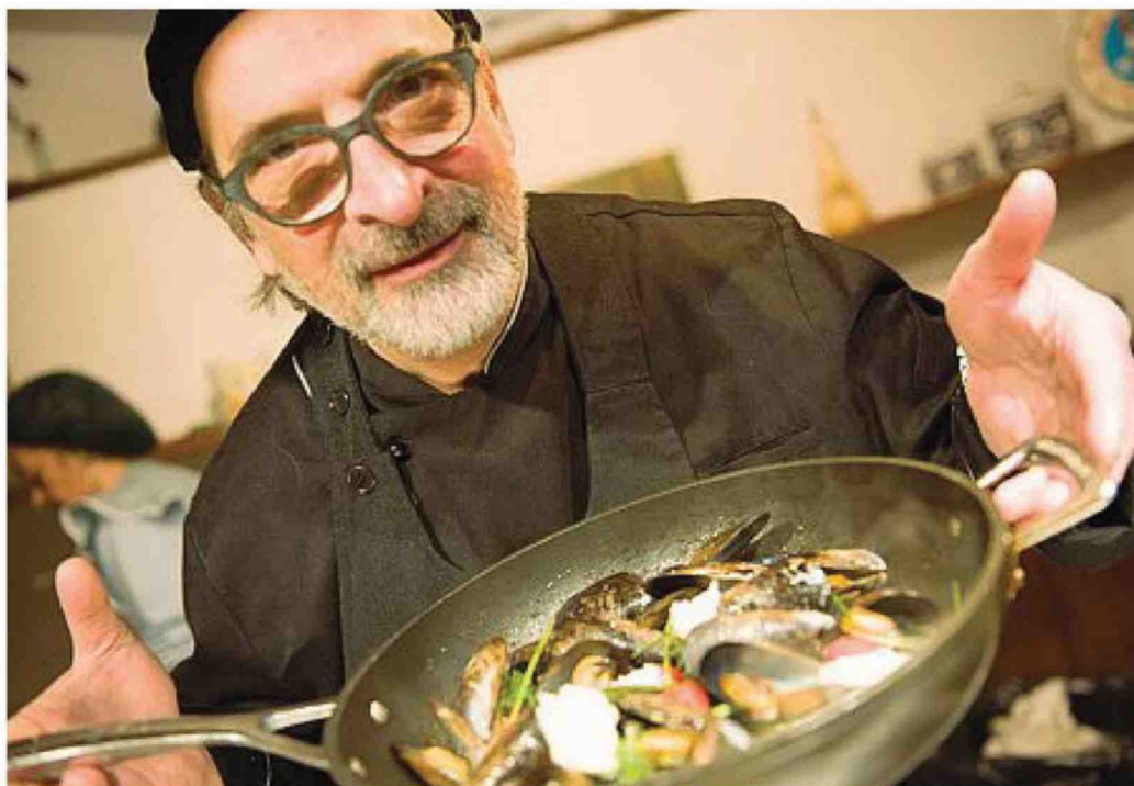
Cuoco Andy Luotto è un attore, comico, cuoco e ristoratore statunitense naturalizzato italiano