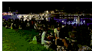
In coppia Sulla piazza sull'acqua a Rimini