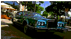
Con gli amici A Gatteo Mare fra le auto americane